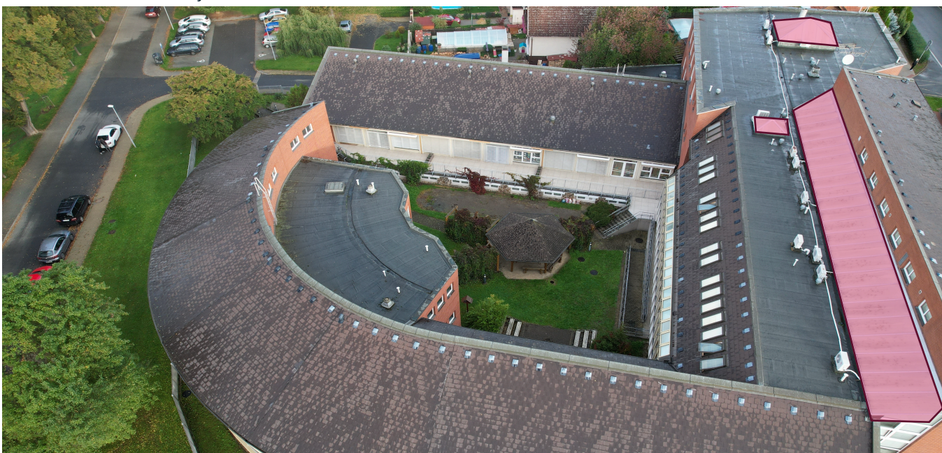
Obrázek č. 4: Měněné světlíky SŠ, ZŠ a MŠ Rakovník

Mimo výměnu popsanou v energetickém posudku, zadavatel požaduje výměnu stávajících polykarbonátových světlíků. Světlíky nemusí splňovat parametry dotačního titulu OPŽP z pohledu součinitele prostupu tepla. Zadavatel požaduje splnění součinitele prostupu tepla U = 1,5 \text{ W.m}^{-2}\text{K}^{-1} .