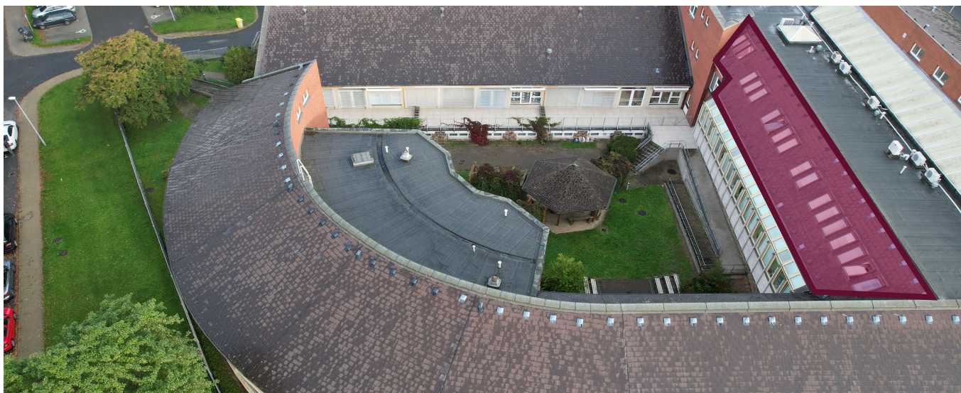
Obrázek č. 3: Výměna střešní krytiny SŠ, ZŠ a MŠ Rakovník

Výměna je požadovaná pouze v místech napojení na plochou střechu, u které je rovněž požadavkem na výměnu krytiny.